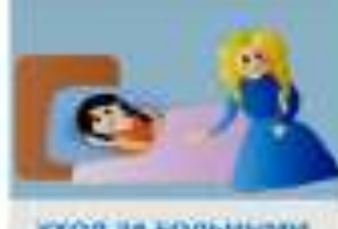
УХОД ЗА БОЛЬНОЙ