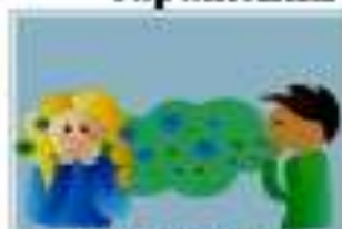
КАШЕЛЬ, ЧИХАНИЕ (Воздушно-капельный путь)